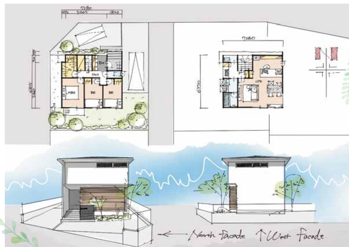
Two-story house [2階建て]