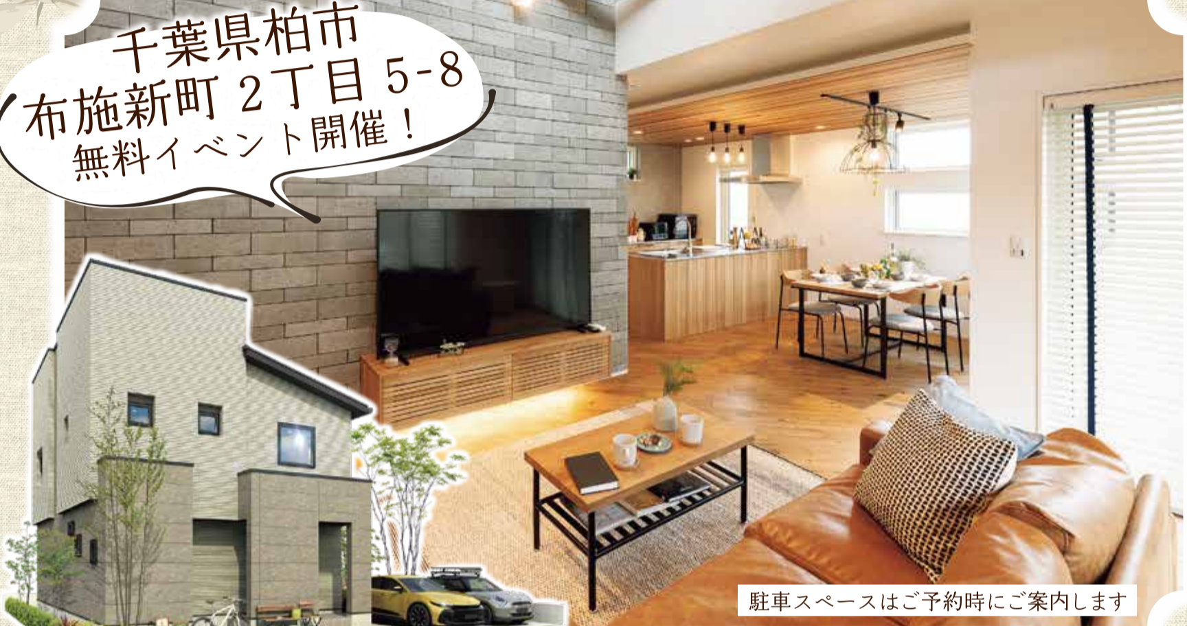
駐車スペースはご予約時にご案内します