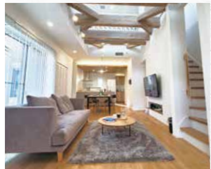
開放的な吹き抜けリビング

経済効果3,000万円! (50年間の計算)※1 先着1組限定 得するモデルハウスお譲りします! すぐにマイホームライフをスタートできます!