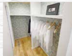
ファミリークローゼット