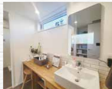
スマートホームミラー