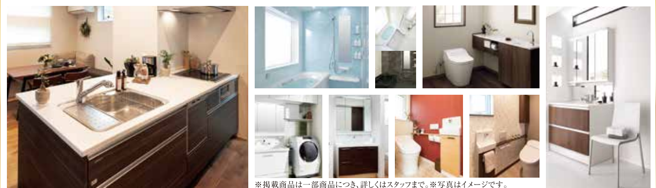
※掲載商品は一部商品につき、詳しくはスタッフまで。※写真はイメージです。

大人気 平屋生活 生活の全てをワンフロアに集約。動線を最適化して日常生活をより便利に。