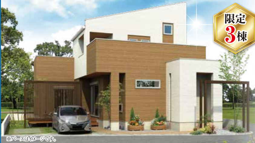
※パースはイメージです。