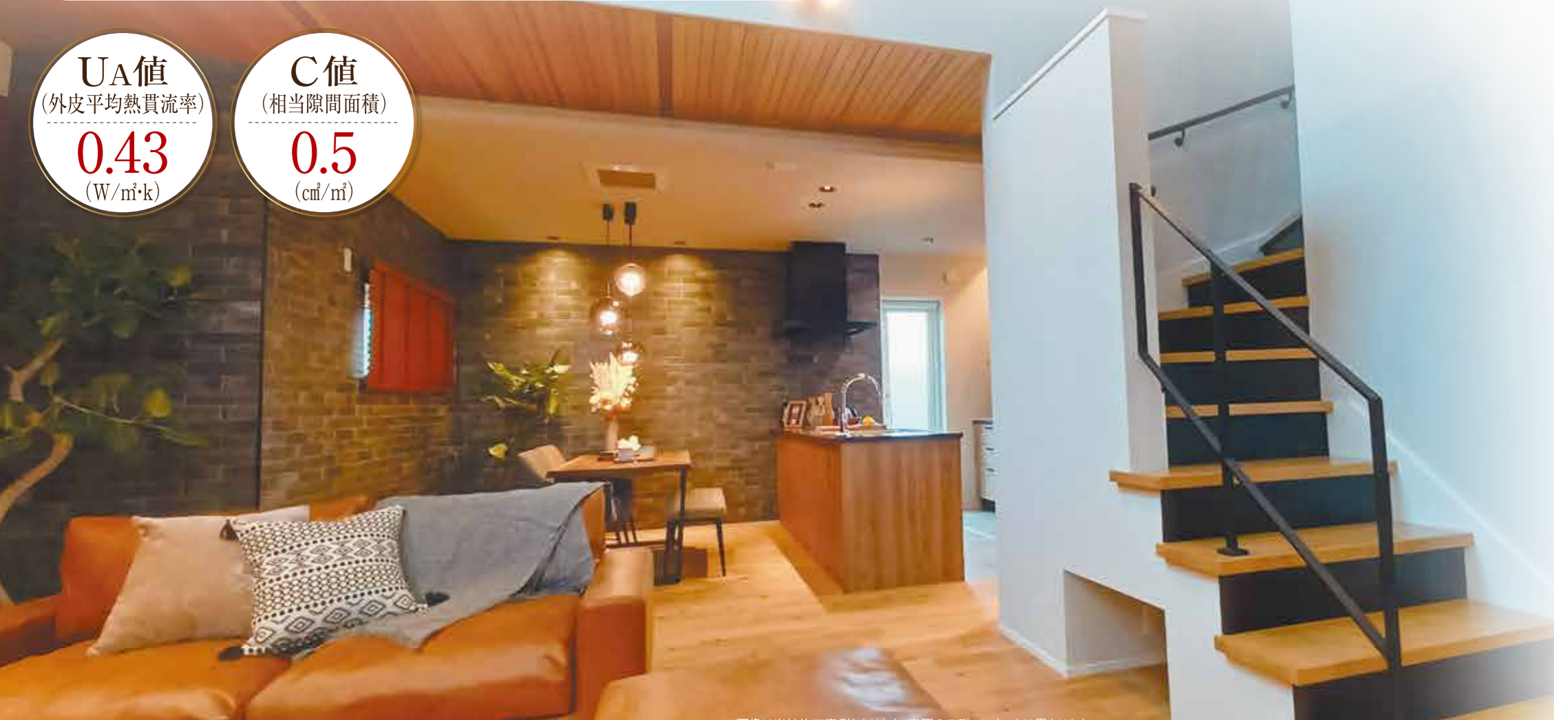
※画像は当社施工事例となります。実際のモデルハウスとは異なります。