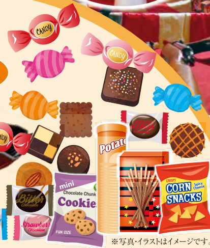
※写真・イラストはイメージです。

安心のコロナ対策 ※お持ちでない方にはマスクプレゼント オンライン面談も可能! マスクの着用徹底! 店内にてアルコール消毒の徹底! 商談スペースへの飛沫防止カーテン設置!