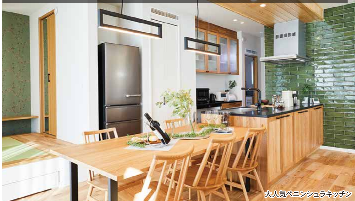
大人気ペニンシュラキッチン