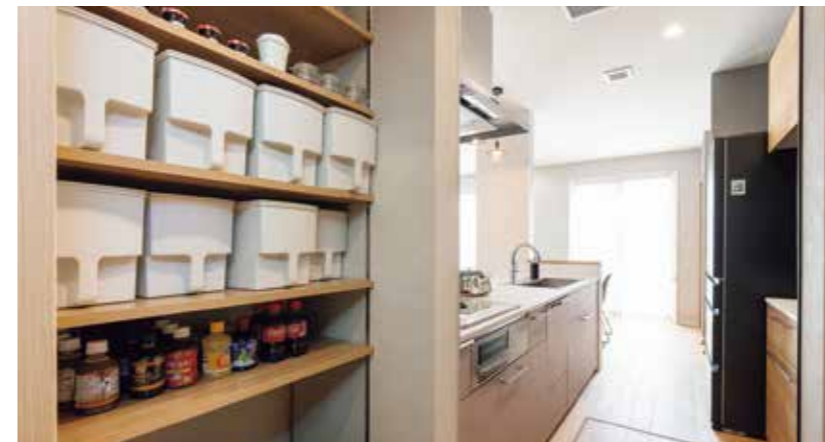
大容量パントリー