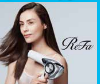
リファ ビューテッドライヤー プロ