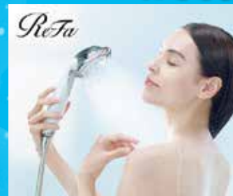
リファ ファインバブル ビューア