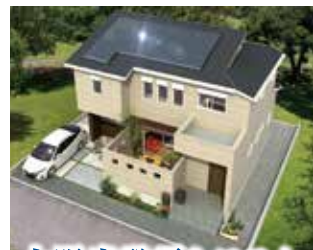
太陽光発電システム

UA値 (外皮平均熱貫流率) 0.22 (W/m²・k) C値 (相当隙間面積) 0.3 (cm/m) 太陽光発電 4.875kW