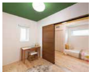
間仕切り可能な子供部屋