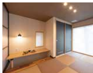
多目的タタミコーナー