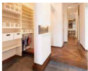
収納豊富なシューズクロック