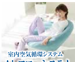
室内空気循環システム Airフローシステム