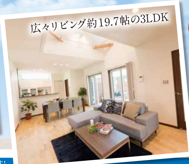
広々リビング約19.7帖の3LDK