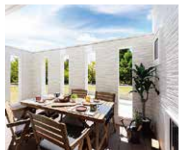
毎日がアウトドア気分のロジア