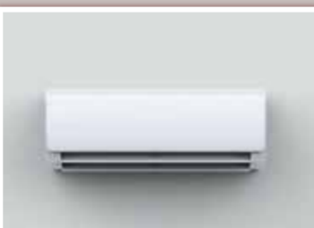
エアコン (18畳用) 1台