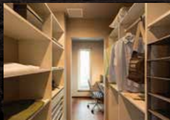
ウォークインクローゼット