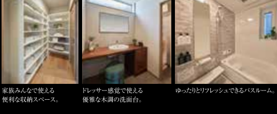
家族みんなで使える便利な収納スペース。ドレッサー感覚で使える優雅な木調の洗面台。ゆったりとリフレッシュできるバスルーム。