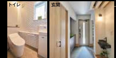
トイレ 玄関 白いレンガ調デザインで清潔感あふれるトイレ。明るい玄関。お洒落な手洗いシンクも。