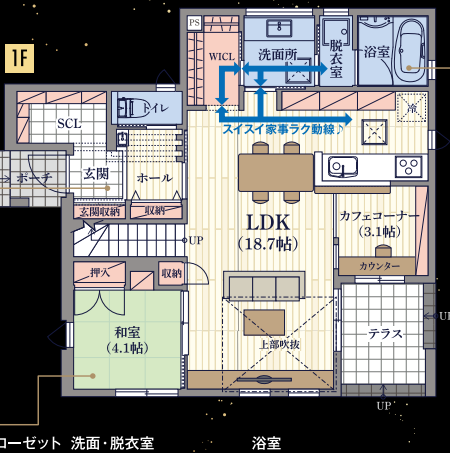
ファミリークローゼット 洗面・脱衣室 浴室