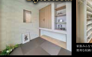
気楽にくつろげるモダン和室。