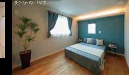
独立性の高い主寝室。