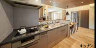
キッチン ワイドで使い勝手の良いキッチン。火を使わない安心のIHヒーター。