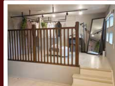
小上がりウォークインクローゼット 1段上がったおしゃれなウォークインクローゼットにお 気に入りの服や季節に合わせた服が一目で分かりま す。ワウダールームとしてもご利用できます。