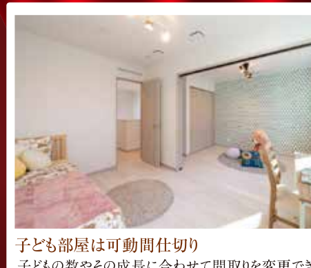
子ども部屋は可動間仕切り 子どもの数やその成長に合わせて間取りを変更でき る間仕切りのあるキッズルーム。環境に応じてさまざま な使い方ができるうれしい空間。