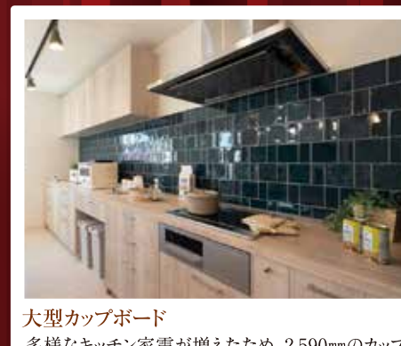
大型カップボード 多様なキッチン家電が増えたため、2,590mmのカップ ボードの需要が増加。たくさん家電もきれいに並べ ることが可能。またキッチン背面にタイルを張ること で、さらに目を引き自慢したくなるキッチンに。