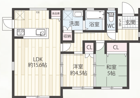
延床面積 / 61.27㎡ (18.53坪)

お1人暮らしやご夫婦世帯にぴったりです♪ シンプル且つコンパクトなサイズ感が暮らしにフィット。 無駄のない暮らしやすさを考えた動線が、快適な毎日を可能にします。