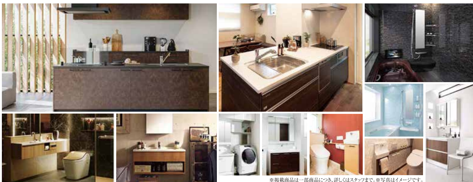
※掲載商品は一部商品につき、詳しくはスタッフまで。※写真はイメージです。