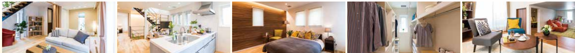
※全ての数値は目安であり、それを保証するものではありません。詳しくはスタッフまで。※掲載の建物バースがイメージです。実際の商品とは異なります。