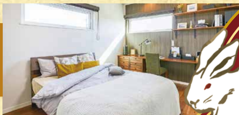
ご夫妻の書斎スペースに 書斎コーナー (主寝室)