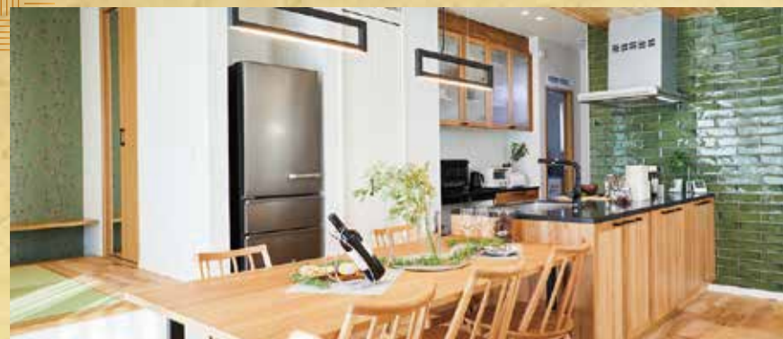
家族が集うキッチン ポポラートキッチン