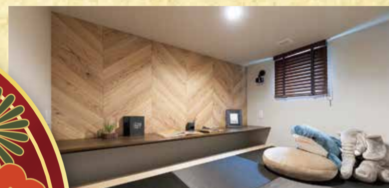
多目的に使えるスペース ステップイン ロフト