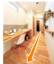
パウダーサロンから 見たただいま動線