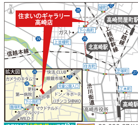
JR信越本線 北高崎駅より徒歩13分 20 630 374*1

ヤマト住建株式会社【本社】〒651-0083神戸市中央区浜辺通5丁目1番14号神戸商工貿易センタービル18階 ■創業/昭和62年11月 ■設立/平成2年1月 ■資本金/3億1千9百万円 ■提携住宅ローン/三菱UFJ銀行 ■取引銀行/三井住友銀行・みずほ銀行・各地域の金融機関 ■宅地建物取引業免許/国土交通大臣(特-30)第20561号(公社)近畿地区不動産公正取引協議会兵庫県宅地建物取引業協会 会員こうベKANSAI住環境協議会会員