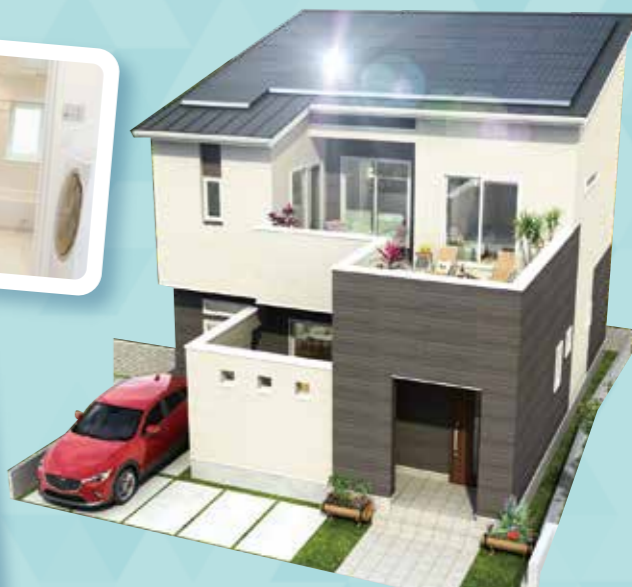
※掲載写真は当社施工事例です。