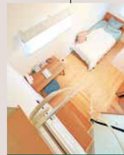
ロフト 収納や寝室、 子どもの秘密基地にも♪