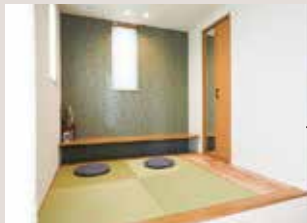
掘込マーク(和室) キッチンからもリビングからも つながる小上がり和室。 壁には堀があり、仕事にも勉強机にも◎