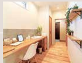
パウダー サロン 洗面付きの広々とした パウダーサロン。 おしゃれな空間で 毎日のメイクも快適に。