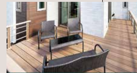
ウッドテラス リビングからつながるテラスで家族や友人と おうち時間を満喫。