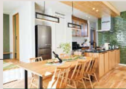
ポポラートキッチン 家族が集い、リビング全体を 見渡せる開放的なキッチン。 水回りが集中しており、家事の時短につながります。