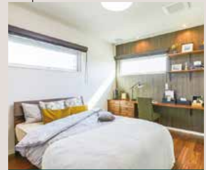
書斎コーナー(主寝室) 書斎スペースでのテレワークや、 照明に設置されたプロジェクターによる 動画鑑賞もできます。