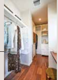
ウォークイン クローゼット 憧れの大容量収納。