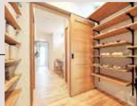
シューズ クローク 抜群の収納力に 加え、玄関に そのまま通しており、 帰宅後すぐに パウダーサロンへ 向かうことができます。