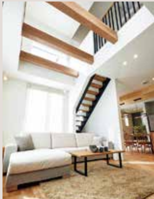
吹き抜けリビング 明るい光が差し込む広々空間。