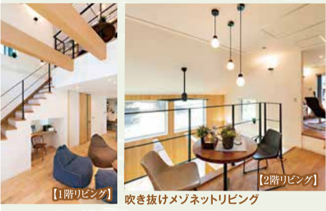
ステップインロフト