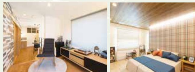
ステップインロフト