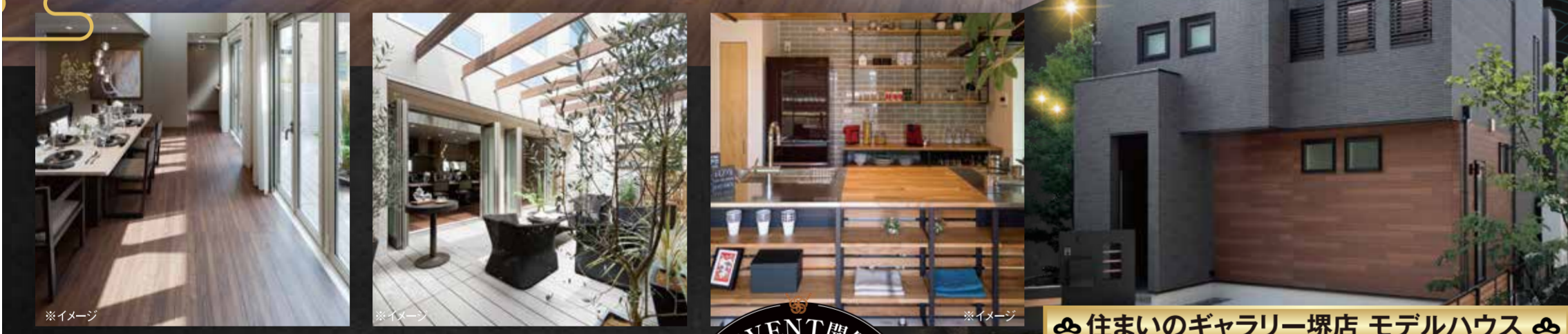
住まいのギャラリー堺店 モデルハウス