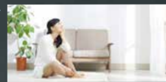
Airフローシステム空気の流れ

1階リビング、2階ホールにエアコンを設置。その近傍に設けた給気口よりダクトを介して中間タクトファンにて各室に吹き出すしくみです。