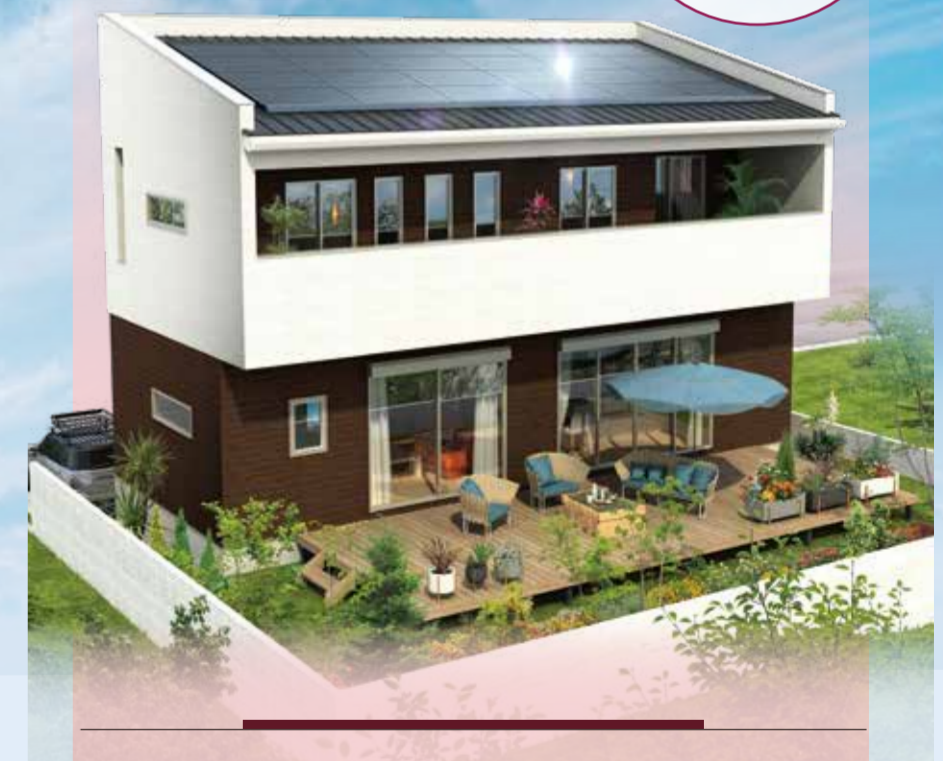
ガーデンフロントキッチンの家