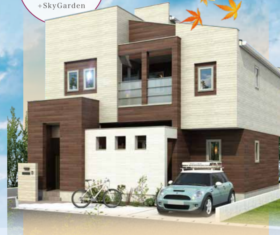
スキップフロアのある家