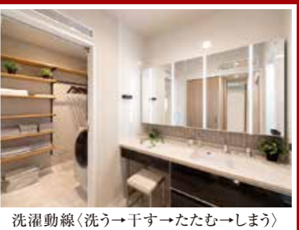
洗濯動線 洗う→干す→たたむ→しまう♪