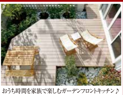
おうち時間を家族で楽しむガーデンフロントキッチン♪