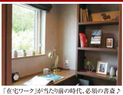
「在宅ワーク」が当たり前の時代、必須の書斎♪