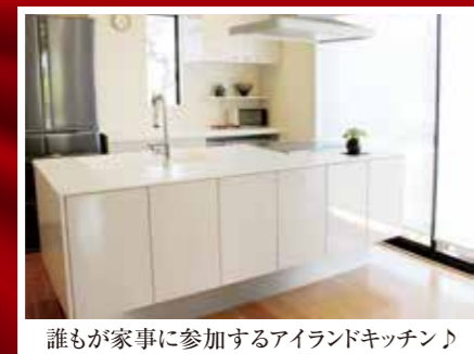
誰もが家事に参加するアイランドキッチン♪