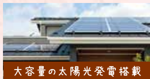
大容量の太陽光発電搭載