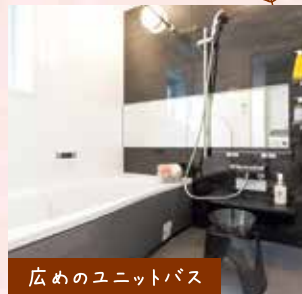
広めのユニットバス