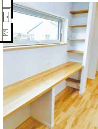
スタディスペース