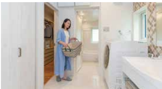
ランドリースペース