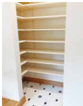
シューズクローク