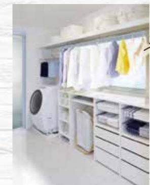
室内干しスペース

収納スペースが多いので用途や種類別に分けたり、よく使う食器やカトラリー、食品やストック用品を入れるのに大変便利です。振り返るだけで食器や調理器具を取り出せるのでキッチンの利便性が上がります。