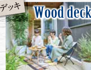
ウッドデッキ Wood deck

ウッドデッキはもうひとつのリビング。開放的なスペースで家族や友人とランチやティータイム、ガーデニングなど自由に楽しめます。