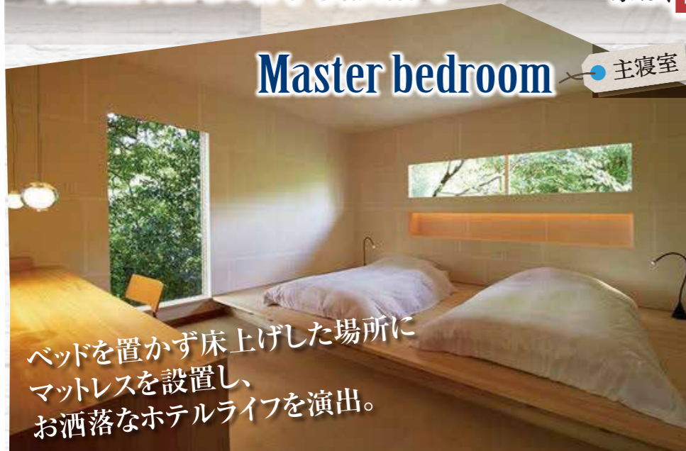
Master bedroom 主寝室

ベッドを置かず床上げした場所に マットレスを設置し、 お洒落なホテルライフを演出。