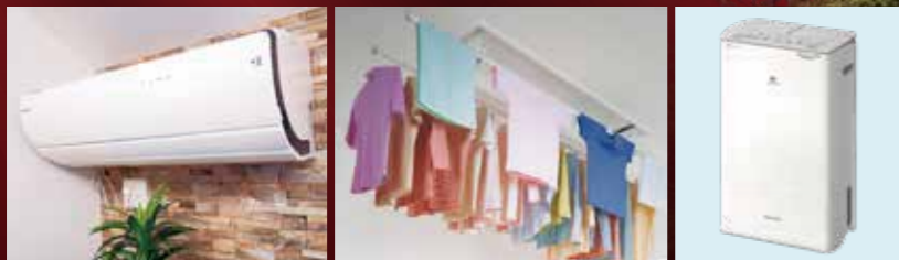
※メーカーについては当社指定の商品になります。