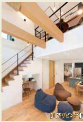
吹き抜けメゾネットリビング