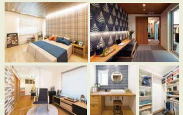
ステップインロフト パウダーサロン シューズクローク