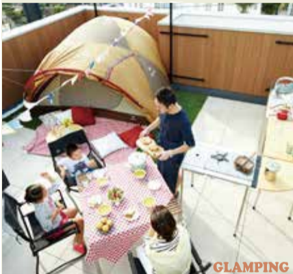
GLAMPING アウトドアを満喫♪ グランピングも可能なフラットバルコニー