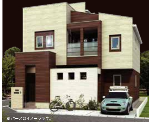
※パースはイメージです。