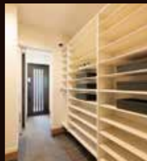
シューズクローズ

帰宅→手洗い→部屋着→リビングへ。 帰宅後のルーティンを自然な動線で 行えるように考えられた 「ただいま動線」をご体感ください。