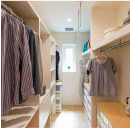
ファミリークローゼット