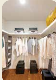
WICL ウォークイン クローゼット

延床面積 126.99㎡ (38.41坪) 1F面積:64.18㎡ 2F面積:54.79㎡ PH面積:8.02㎡