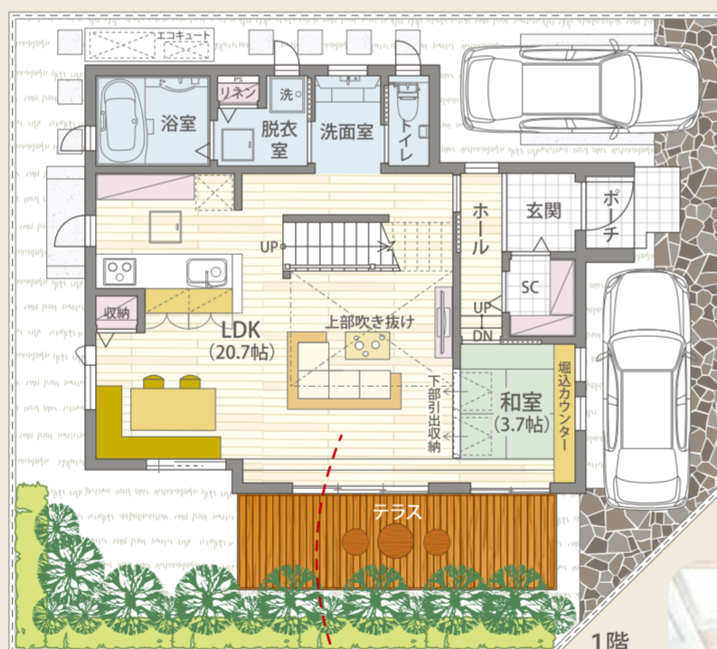
LDK リビング・ダイニング・キッチン