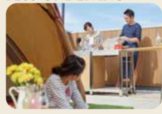
PLUS ONE LIVING

延床面積 126.99㎡ (38.41坪) 1F面積:64.18㎡ 2F面積:54.79㎡ PH面積:8.02㎡