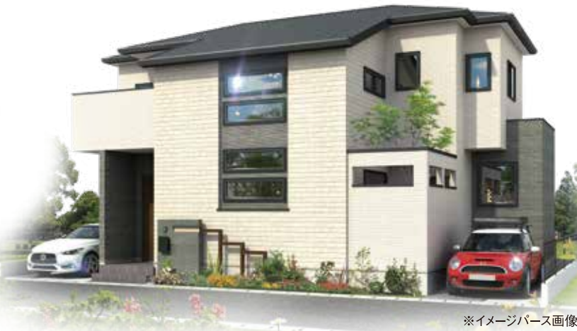
※イメージバース画像

お友だちと!家族と! ゆったりとカフェ気分女子会やリモートワーク体験を モデルハウスを貸し切ってゆっくり見学してみませんか?