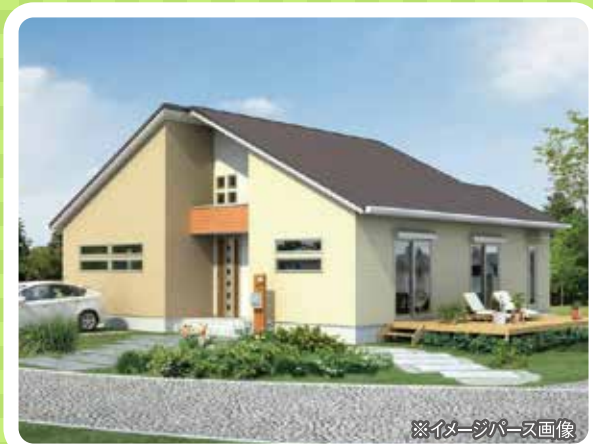
※イメージパース画像