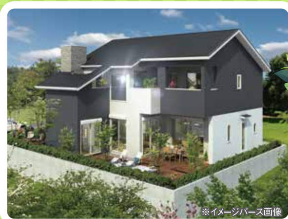
※イメージパース画像