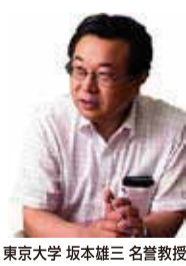
空調システム監修 東京大学 名誉教授 坂本 雄三 / 日本大学理工学部建築学科 助教 井口 雅登