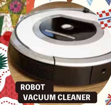
ROBOT VACUUM CLEANER