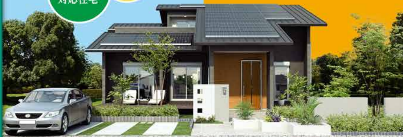
※建物パースはイメージです。実際とは異なります。