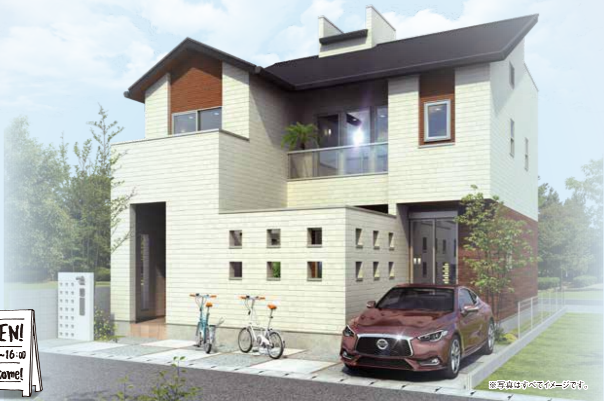
※写真はすべてイメージです。