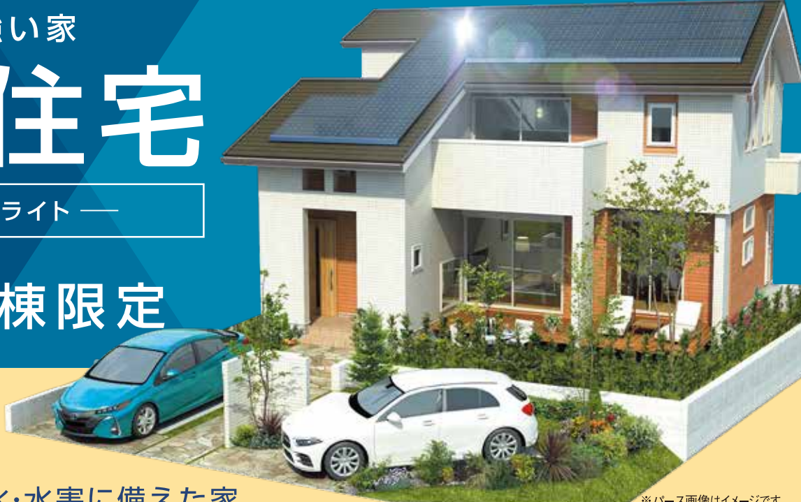
※パース画像はイメージです。