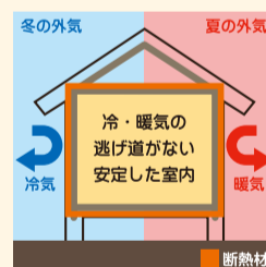
【家全体をすっぽり断熱】