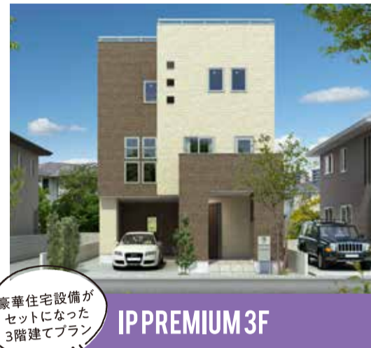
豪華住宅設備が セットになった 3階建てプラン IPP PREMIUM 3F