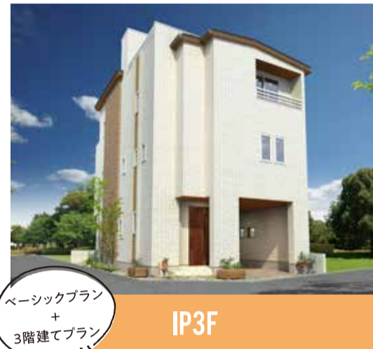
ベーシックプラン + 3階建てプラン IP3F