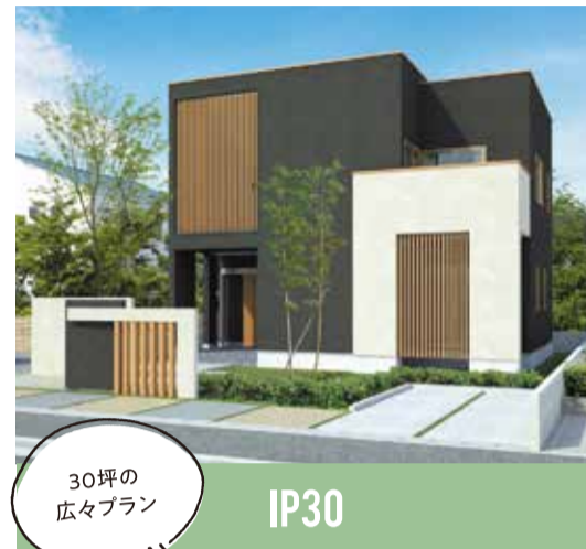
30坪の 広々プラン IP30