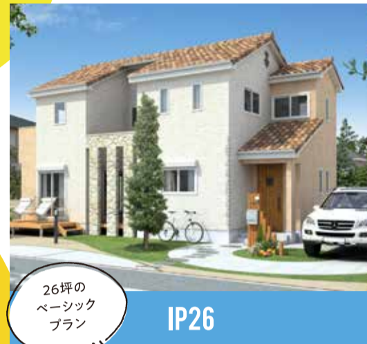
26坪の ベーシック プラン IP26