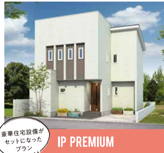
豪華住宅設備が セットになった プラン IP PREMIUM