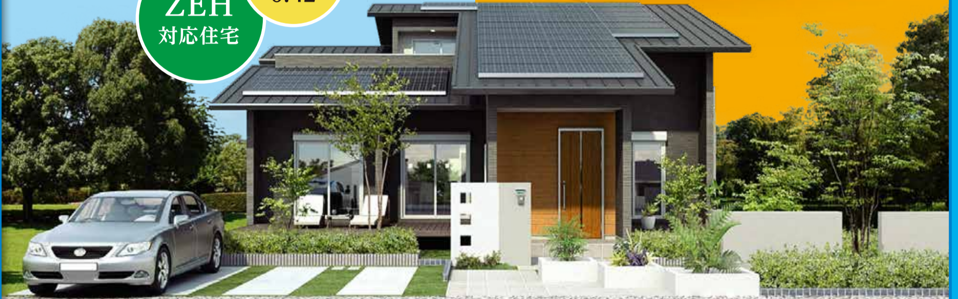
※建物パースはイメージです。実際とは異なります。