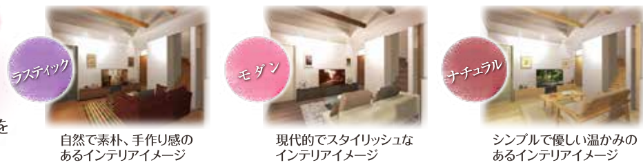
自然で素朴、手作り感のあるインテリアイメージ

3つのスタイルから お客様の好みに応じて、 インテリアコーディネートをご提案いたします