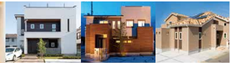
※当社施工イメージ

ヤマト建屋の女性社員によって発足されたプロジェクトです。ハウスメーカーとして多くの家づくりに携わり、女性目線だからこそ気になる細かなアイデアを集めるべく、すでにお住まいいただいているOB様にご意見を伺ったり、女性社員を中心に定期的にミーティングをおこなっています。日々の暮らしなかで料理・掃除・洗濯や育児をもっと効率よく、家族も一緒に参加できるような家をご提案できれば、毎日をもっと楽に快適になると「なでしこプロジェクト」は考え、お伝えしていきます。