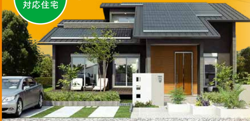
※建物パースはイメージです。実際とは異なります。

ヤマト住建の高気密・高断熱だから可能な市販の家庭用 ルームエアコン1台で全館空調する画期的なシステム