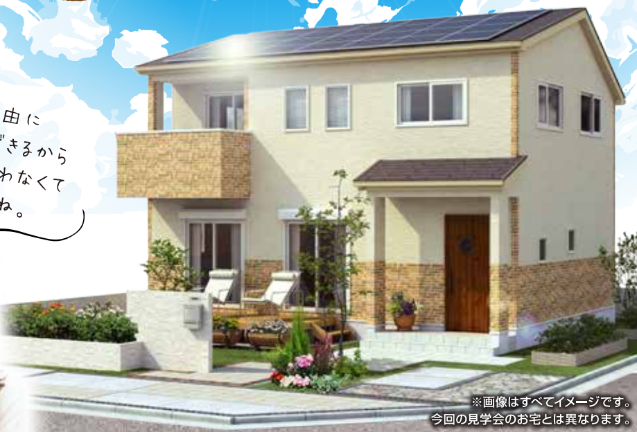
※画像はすべてイメージです。今回の見学会のお宅とは異なります。