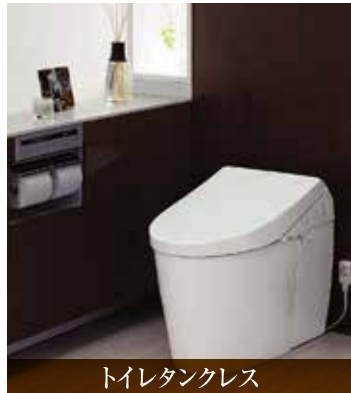
トイレタンクレス