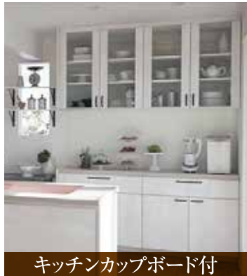
キッチンカップボード付