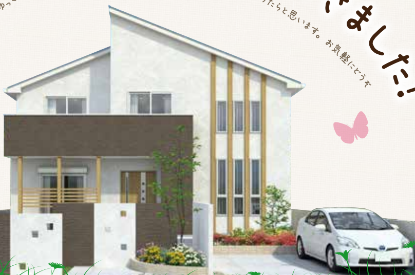
※画像はすべてイメージです。今回の見学会のお宅とは異なります。