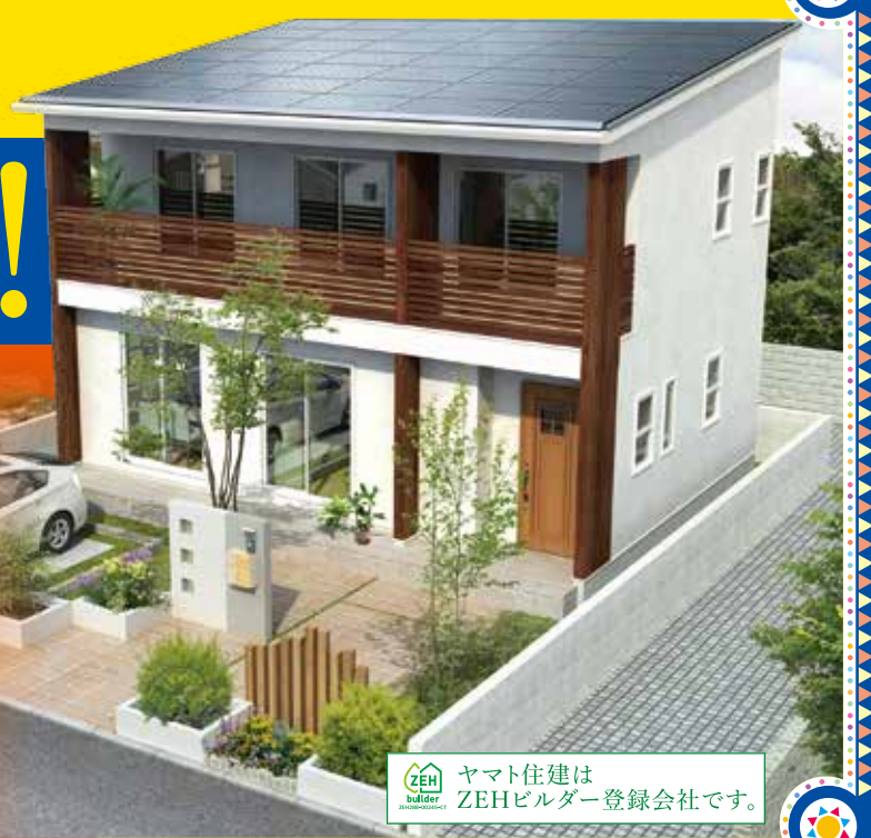
ZEH builder ヤマト住建は ZEHビルダー登録会社です。