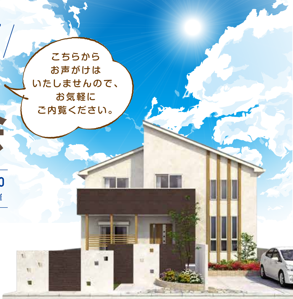
※画像はすべてイメージです。今回の見学会のお宅とは異なります。