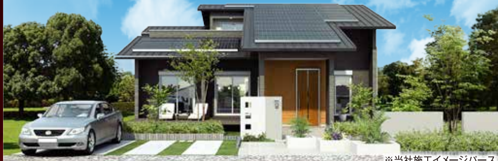
※当社施工イメージパース

ヤマト住建の高気密・高断熱だから可能なエアコン1台で全館空調する画期的なシステム