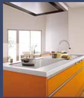
フラット対面プラン (アイランド) ビタミンカラーのアイランドキッチンが、お部屋の中でアクセントに。また、フラットなトリプルワイドIHは、対面プランでもキッチンをすっきり印象付けます。