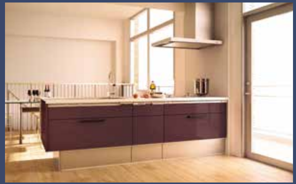
フロート対面プラン (ペニンシュラ) 浮遊感のあるフロートデザインは、空間に広がり感を与えます。ボルドーワインのような深みのある色合いを選んでも、重くなりすぎずに高級感を演出します。