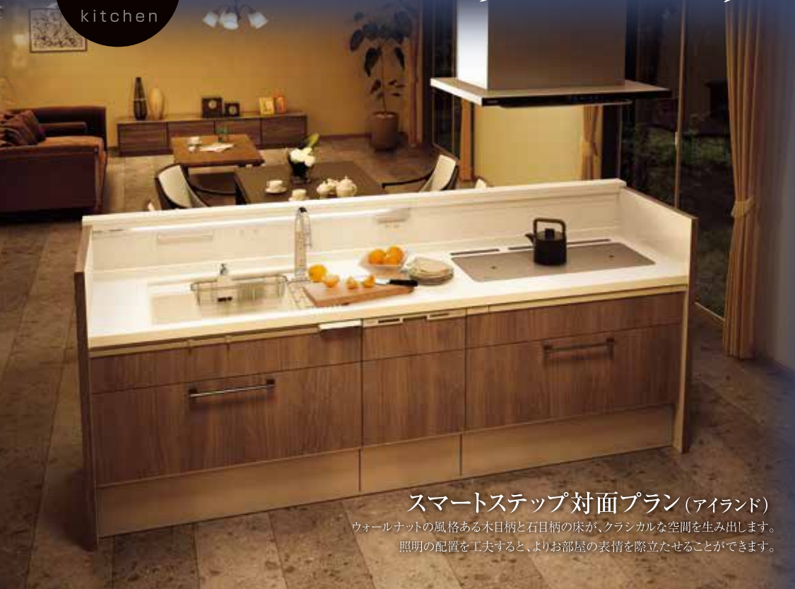
スマートステップ対面プラン (アイランド) ウォールナットの風格ある木目柄と石目柄の床が、クラシカルな空間を生み出します。照明の配置を工夫すると、よりお部屋の表情を際立たせることができます。